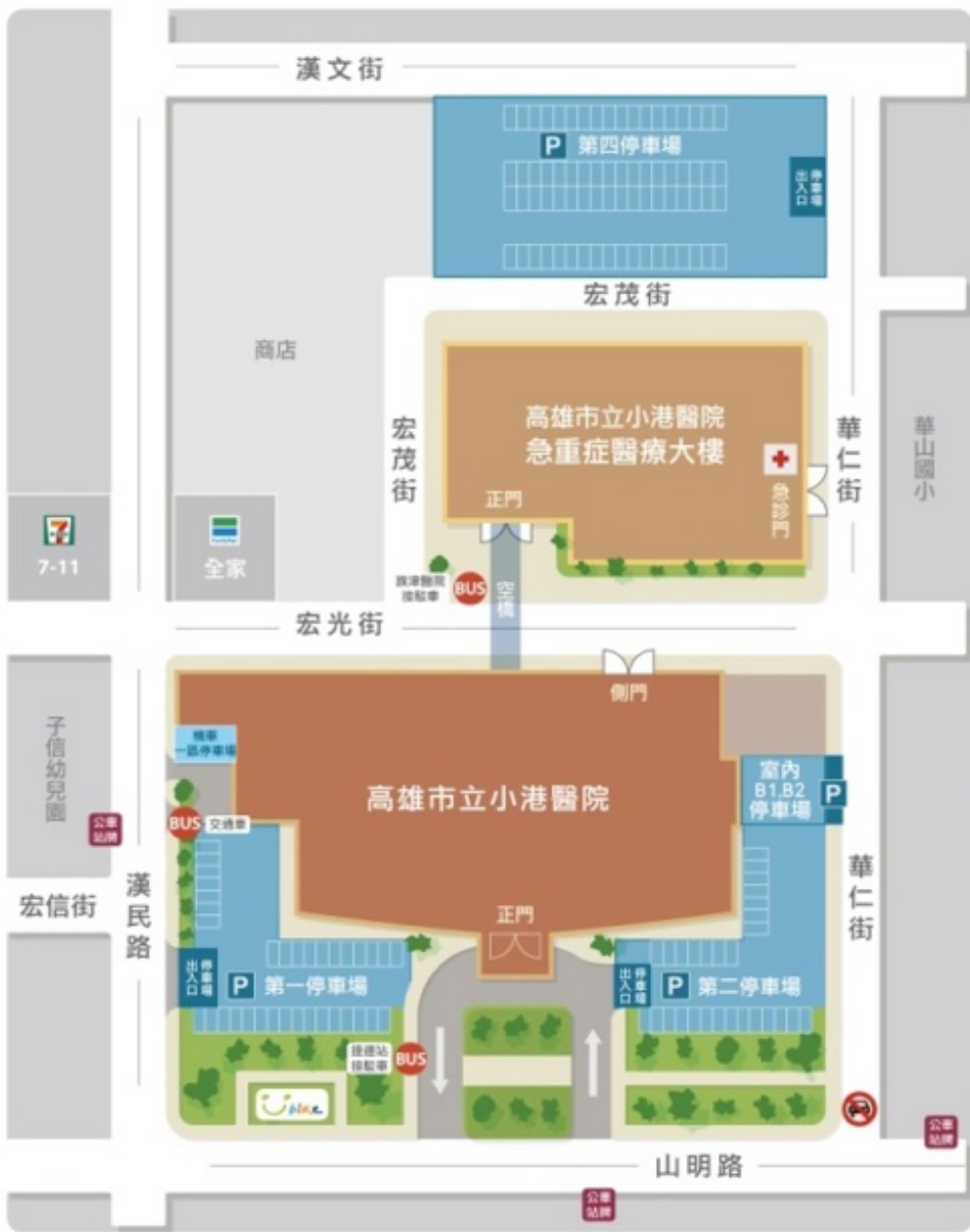
高雄市立小港醫院周邊停車配置圖